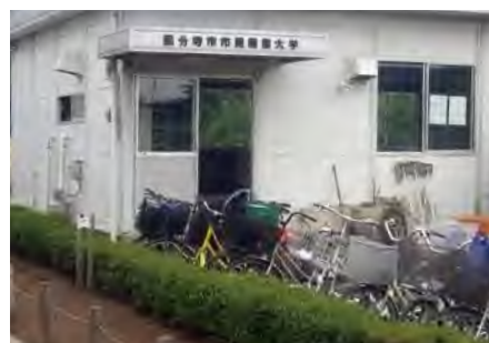
市民農業大学の集会施設