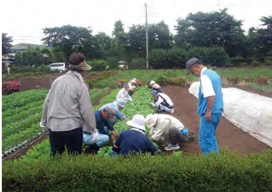
農作業実習をする受講生