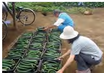
キュウリを収穫する受講生