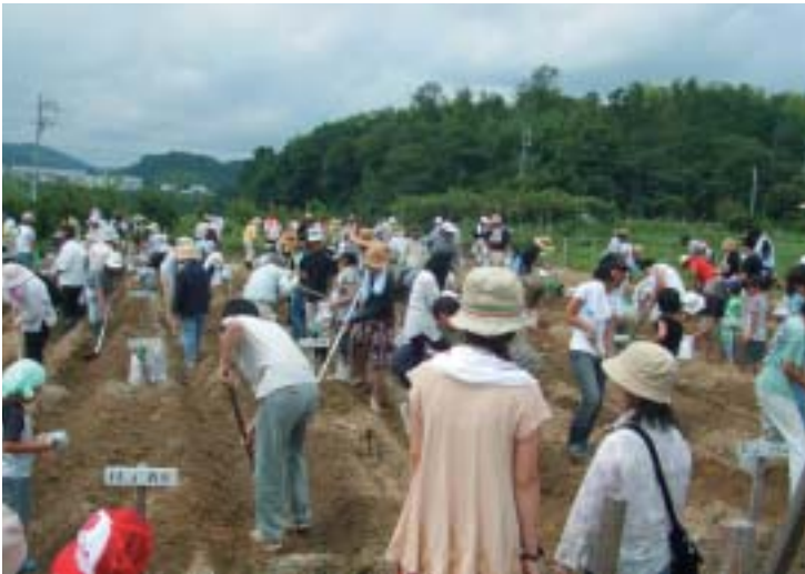
体験農園のイベント