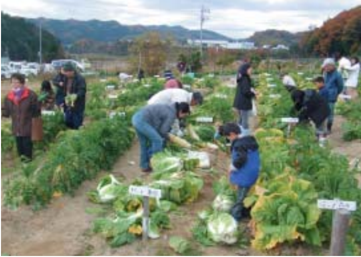
体験農園のイベント