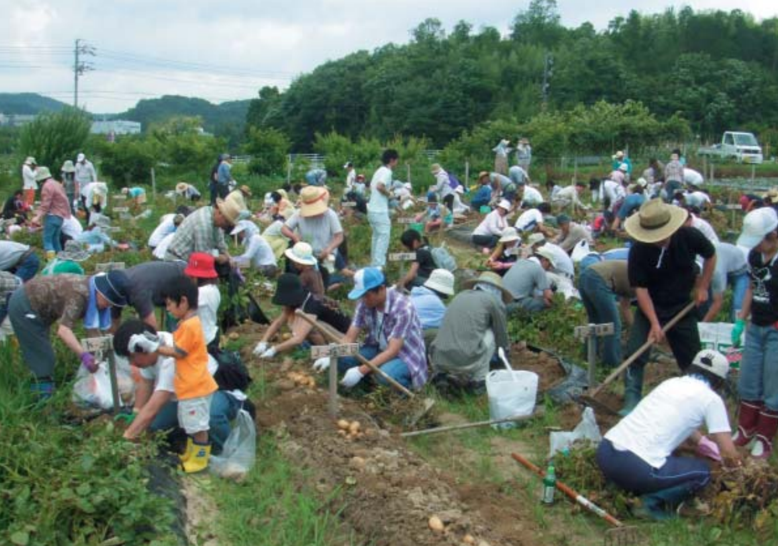
体験農園のイベント風景