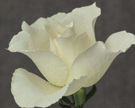
ホワイトサクセス

エレガントな白いバラを代表する最高クラスの花として、ホワイトサクセスはオープン当時よりずっと愛されてきました。その魅力は、反りかえるように優雅に咲いてどこから見ても美しいフォルムと、純白を極めた花びらの色。ローズギャラリーの白の基準は、このホワイトサクセスから始まったといっても過言ではありません。香りの特徴としてはスバイシーな香り。開くほどにほのかに立ち上ります。日本では「マダムサチ」という愛称でも。