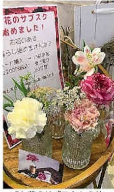
「お花のサブスク」のサービスを始めたロランジュ 阪急三番街店=大阪市北区

2030 SDGsで変える コロナ禍で打撃を受けている花業界。需要が急減したために刈り取って処分したり、栽培面積を縮小したりする事態に追い込まれた。業界団体は花を活用した大型イベントを開くなどし、「フラワーロス(花の廃棄)」の解消による農家らの支援に乗り出した。(西尾邦明)