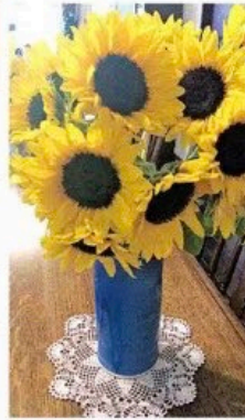
スマイルフラワープロジェクトで注文し1週間ほどで届いたヒマワリ

https://www.nikkei.com/article/DGXMZO62332910V00C20A8W07000