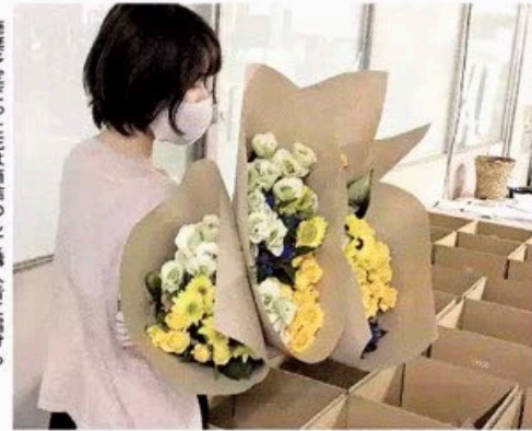
廃棄予定だった花は種別して購入者に届けらる(富山県射水市のJFC配送センター)

廃棄予定の花であることに加え、卸売市場などを経出しないので中間コストが減少し、低価格で買い取れるという。通常、花の店頭価格は売れ残って廃棄処分となる分も見込み高めに付けられるが、ネット販売なら受注した分だけ仕入れるため上乗せ費用がかからない。こうした事情が店頭に比べて大幅に安い値段設定の背景にあるという。 さらに「卸業者や市場などを経田しない分、消費者に届くまでの時間が短く輸送による花の傷みも少ない。店頭より鮮度の高い花を買える(J