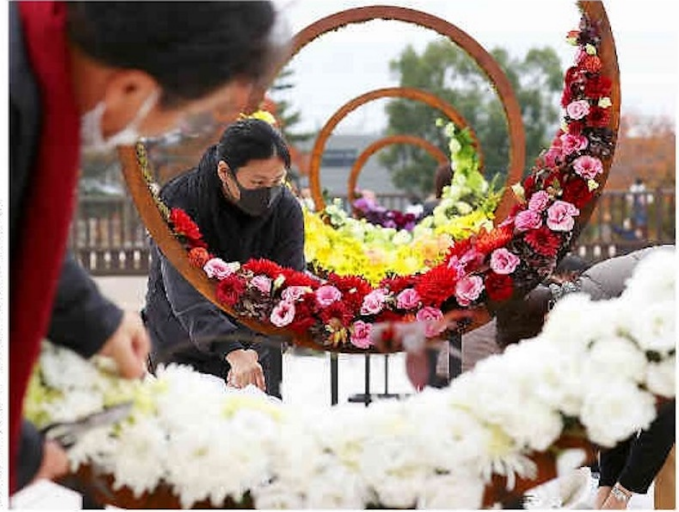
興福寺中金堂前でオフェ「五輪花」に飾り付けをする関係者ら11日、奈良市